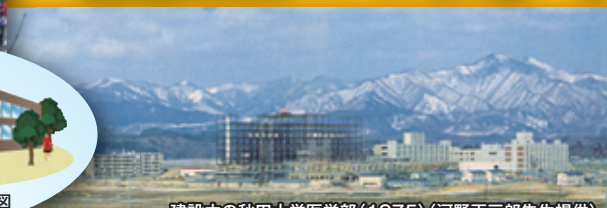
建設中の秋田大学医学部 (1975)