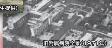
旧附属病院全景 (1971年)